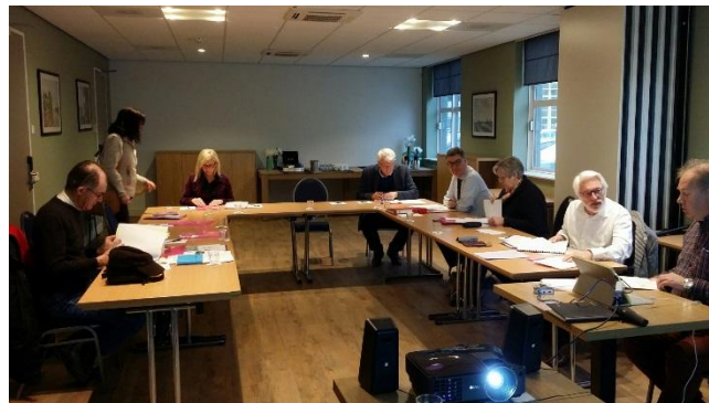
Il bureau della CPNUE a lavoro

Si è poi discussa l'idea di essere presenti al prossimo congresso del notariato mondiale, gestita dall'Unione Internazionale del Notariato Latino, che si terrà in ottobre a Parigi, ma non vi sono per ora certezze al riguardo.